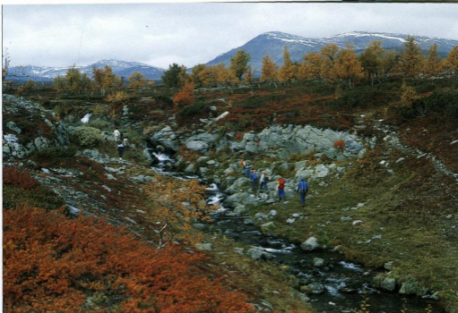
1 En grupp turister med kunnig guide på höstvandring i södra fjällen.

ga på 4–5 procent per år under resten av seklet. Turism definieras då som alla resor där man är borta minst 24 timmar från hemlandet (internationell turism) eller minst 24 timmar från hemorten (nationell turism). Såväl affärs- som fritidsresor ingår i turismbegreppet, även om man i dagligt tal mest tänker på fritidsresandet.