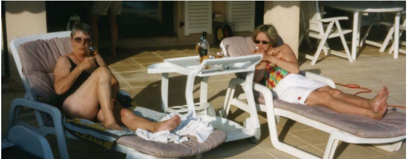
och skön avkoppling vid poolen på Jas Madame