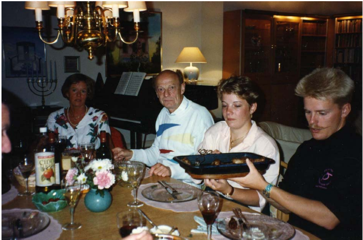
Middag med mustaschprydd servitör