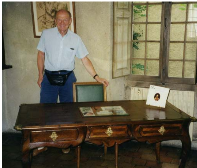
Bernadottes hus i staden Pau där Jean Babtiste Bernadotte föddes; från 1818 Sveriges kung Karl den 14 Johan