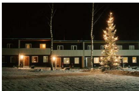
Jul i Tappström