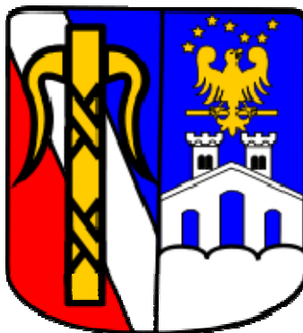
Släkten Bernadottes vapen