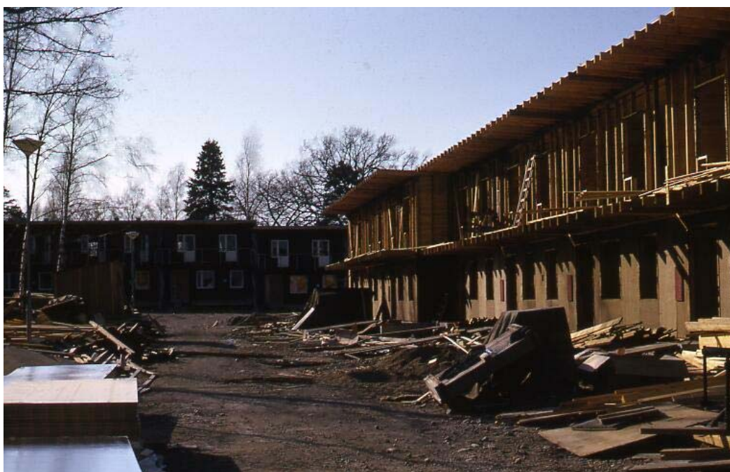
A- och B-längan under byggnation