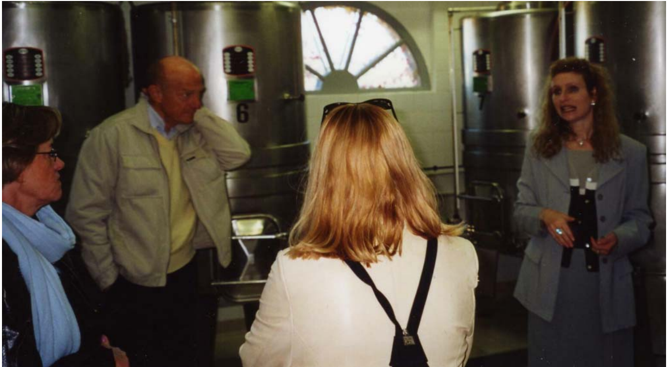
med besök på den svenska vingården Rabięga