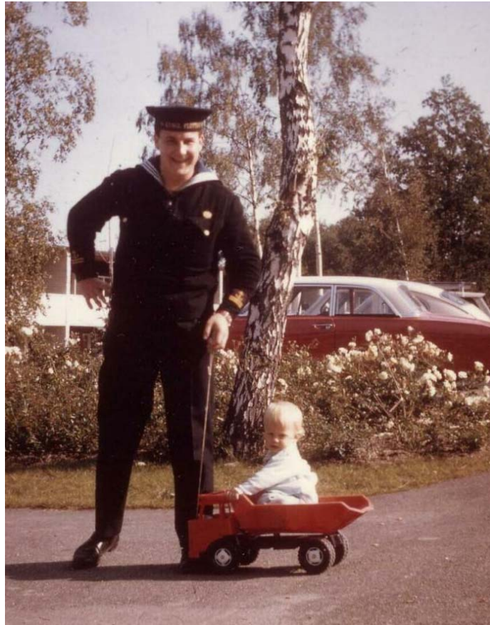
Högertrafikomläggningens huvudperson med liten trafikant utanför A-längan