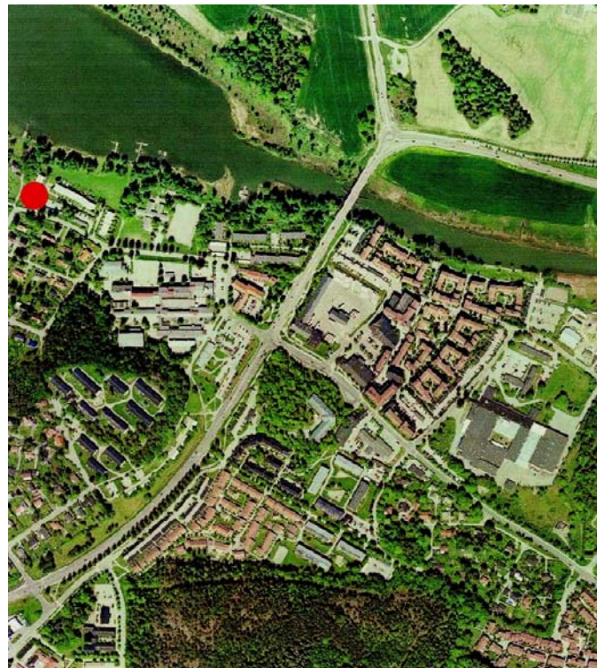
Röd cirkel = A-längan