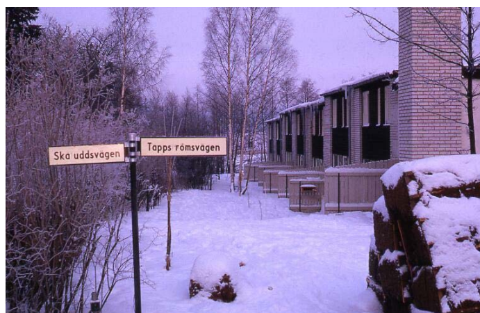
Vinter och sommar