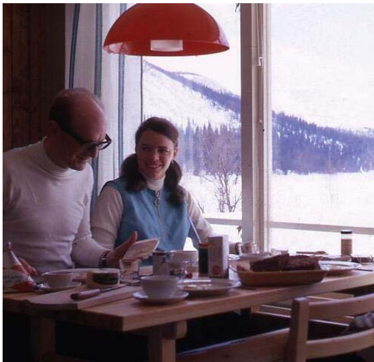
Bydalen 24-30 mars 1968