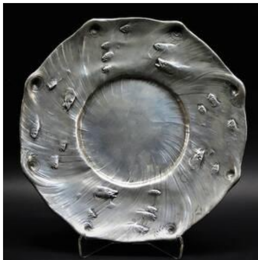
Tennfat med fiskmotiv (formgivare Olof Ahlberg)

Olof Ahlberg (1876-1956) har formgivit fatet med fiskarna samt skrivbordsuppsättningen.