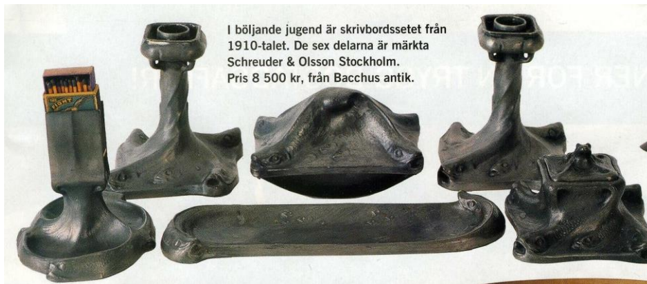
I böljande jugend är skrivbordssetet från 1910-talet. De sex delarna är märkta Schreuder & Olsson Stockholm. Pris 8 500 kr, från Bacchus antik.